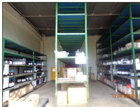
ภาพที่ 2.2-29 พื้นที่เก็บสารเคมีภายในอาคาร