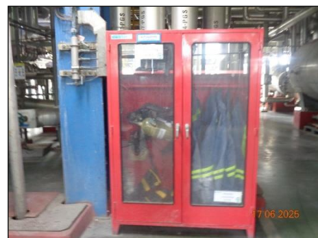
ตู้เก็บอุปกรณ์ดับเพลิง