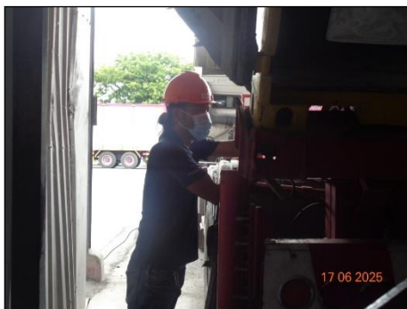
ภาพที่ 2.2-7 พนักงานสวมใส่อุปกรณ์คุ้มครอง ความปลอดภัยส่วนบุคคล