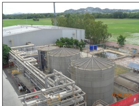
ภาพที่ 2.2-31 ระบบสเปรย์น้ำรอบถังเก็บ EG