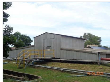
ภาพที่ 2.2-20 Water Pond