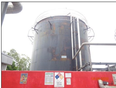
ภาพที่ 2.2-30 ระบบสเปรย์น้ำ รอบถังเก็บน้ำมันเชื้อเพลิง