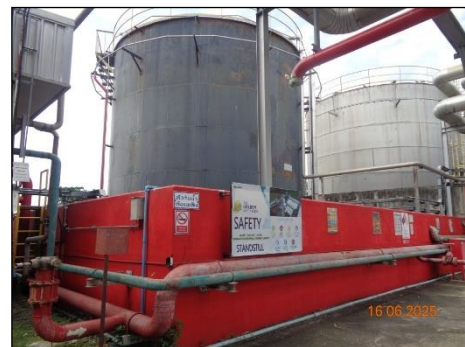
ภาพที่ 2.2-36 คั่นกันรอบถังเก็บ Fuel Oil