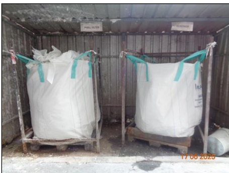
ภาพที่ 2.2-15 ถุง Jumbo Bag บรรจุ Oligomer