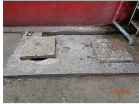
ภาพที่ 2.2-12 บ่อเกรอะ (Septic Tank)