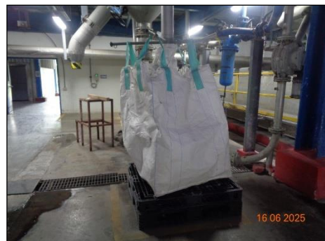
ภาพที่ 2.2-16 ถุง Jumbo Bag บรรจุ Polymer Lump & Chips