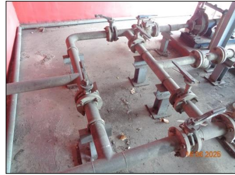
ภาพที่ 2.2-34 วาล์วปิด-เปิด ท่อสารเคมี ที่อยู่นอกคั่นกันสารเคมี