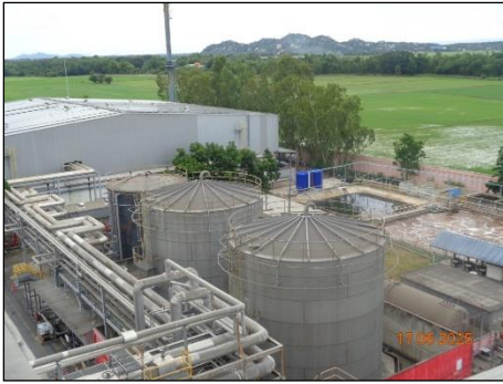
ภาพที่ 2.2-11 ระบบบำบัดน้ำเสีย