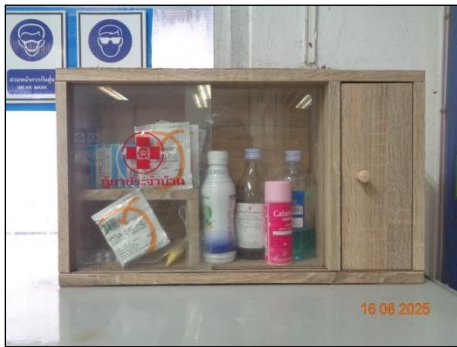
ภาพที่ 2.2-24 ตู้ปฐมพยาบาลเบื้องต้น