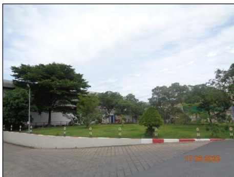
ภาพที่ 2.2-35 พื้นที่สีเขียวของโครงการ