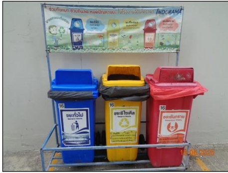
ภาพที่ 2.2-17 ถังขยะที่มีฝาปิดมิดชิด