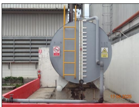
ภาพที่ 2.2-41 คั่นกันรอบถังเก็บ Diesel Oil