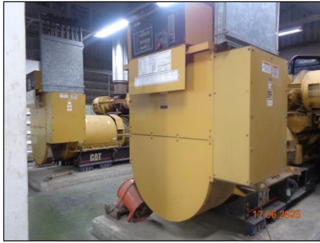
ภาพที่ 2.2-5 ระบบไฟฟ้าสำรอง Diesel Generator