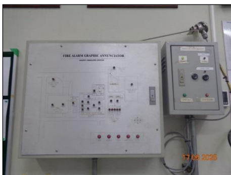
Fire Alarm Graphic Annunciator