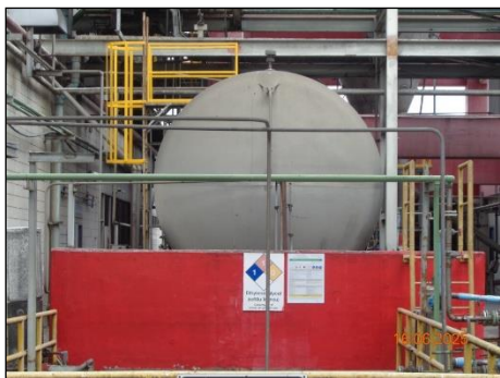
ภาพที่ 2.2-39 คั่นกันรอบถังเก็บ EG Daily Tank