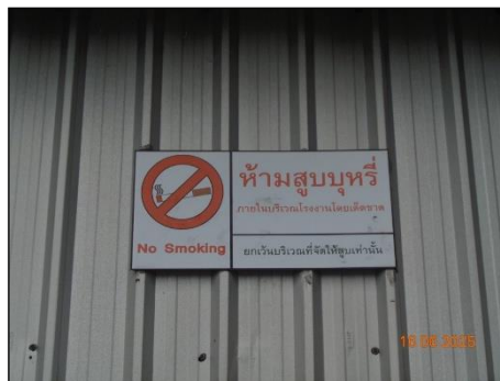
ภาพที่ 2.2-32 ป้ายห้ามสูบบุหรี่