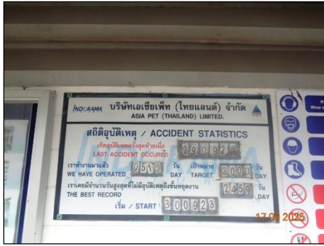
ภาพที่ 2.2-22 ป้ายแสดงสถิติอุบัติเหตุ