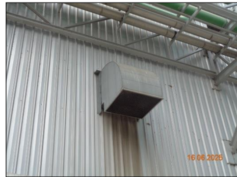
ภาพที่ 2.2-25 การจัดการเรื่องการระบายอากาศ