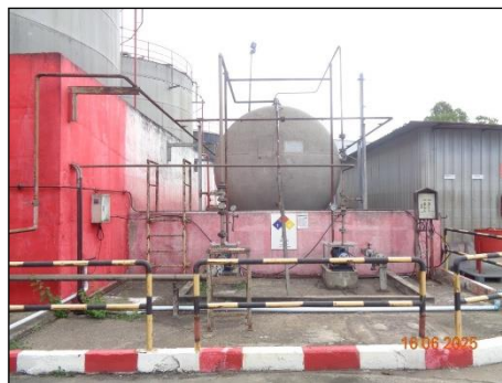
ภาพที่ 2.2-40 คั่นกันรอบถังเก็บ DEG