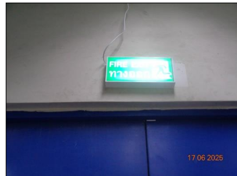
ป้ายแสดงทางหนีไฟ