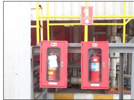
Fire Hose Cabinet