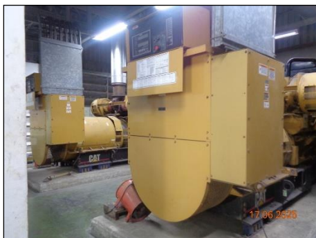
ภาพที่ 2.2-9 Silencer ของเครื่อง Diesel Generator