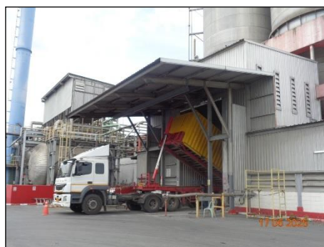
ภาพที่ 2.2-4 รถบรรทุกขณะจอดเพื่อขนถ่ายวัสดุดิบ