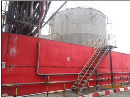
ภาพที่ 2.2-33 Elevated Walkway