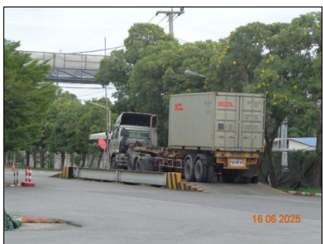
ภาพที่ 2.2-3 รถบรรทุกผลิตภัณฑ์