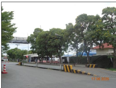
ภาพที่ 2.2-19 จุดซังน้ำหนักรถบรรทุก