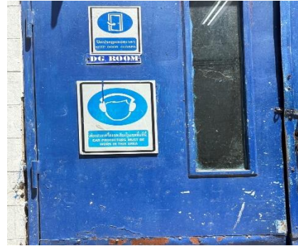
ภาพที่ 2.2-6 ป้ายเตือนให้สวมใส่อุปกรณ์ ป้องกันเสียงดัง