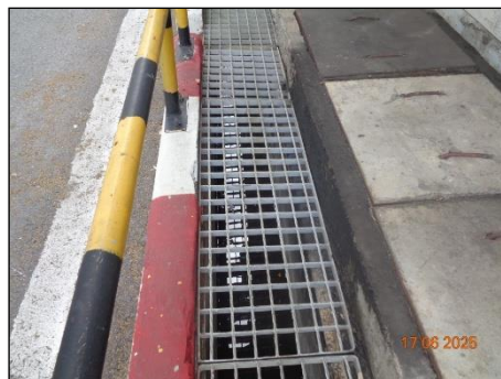
ภาพที่ 2.2-21 รางระบายน้ำฝน