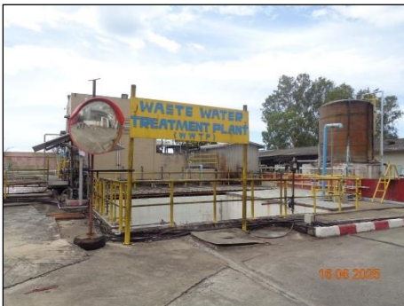
ภาพที่ 2.2-13 บ่อกักน้ำทิ้งฉุกเฉิน