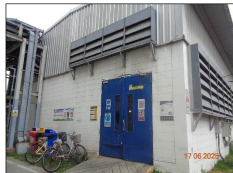
ภาพที่ 2.2-10 อาคารที่ภายในติดตั้งเครื่อง Diesel Generator