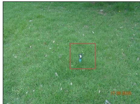
ภาพที่ 2.2-14 การนำน้ำหลังผ่านการบำบัด มาใช้รดน้ำต้นไม้