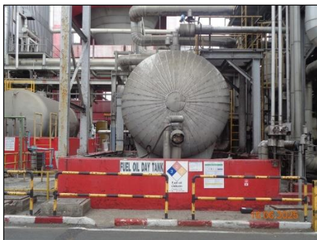
ภาพที่ 2.2-37 คั่นกันรอบถังเก็บ Fuel Oil Daily Tank