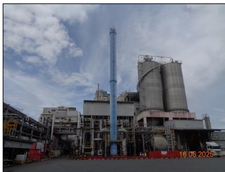
ภาพที่ 2.2-1 HTM Heater Stack