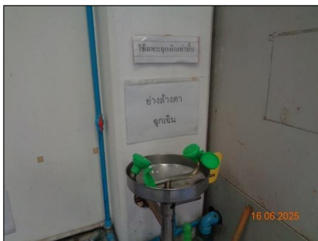
ภาพที่ 2.2-26 ฝักบัวฉุกเฉินและที่ล้างตา