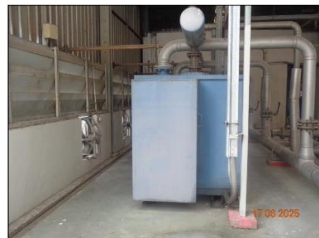
ภาพที่ 2.2-8 Silencer ของเครื่อง Compressor