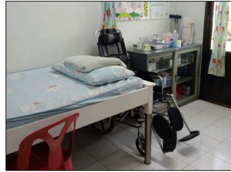
ภาพที่ 2.2-23 ห้องปฐมพยาบาล