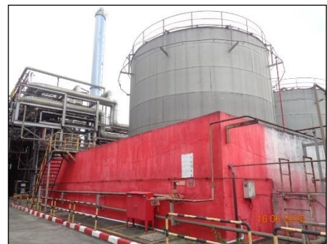
ภาพที่ 2.2-38 คั่นกันรอบถังเก็บ EG