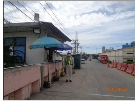
ภาพที่ 2.2-18 พนักงานรักษาความปลอดภัย บริเวณทางเข้า-ออก โครงการ